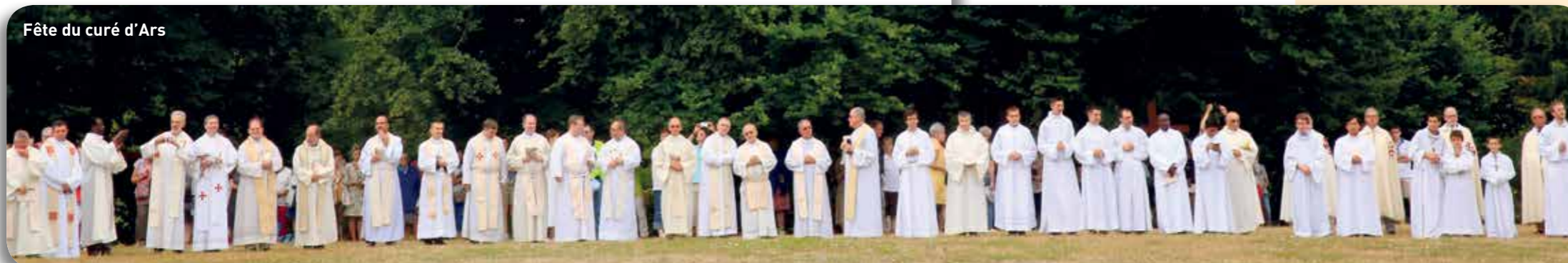
Fête du curé d'Ars