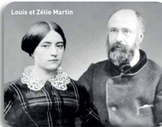
Louis et Zélie Martin

Au milieu du Synode des Evêques à Rome sur la "famille", Louis et Zélie Martin les parents de Sainte Thérèse de l'Enfant Jésus seront canonisés par le Pape François, leur vie fut toute orientée vers le Ciel plus que vers la terre sans pour autant être désincarnée. C'est la rentrée et nous allons tous reprendre notre vie ordinaire, la famille et le travail. Les Martin avaient la foi qui a illuminé leur vie. Ils ont compris qu'un couple n'aura de fécondité que s'il s'ouvre à la relation : aux enfants, à la société ou à l'Eglise. O Seigneur donnez-nous de saintes familles, pas des foyers clos, portes fermées, possession jalouse du bonheur.