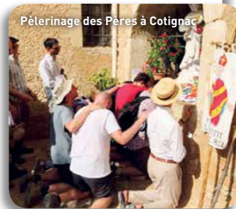
Pèlerinage des Pères à Cotignac