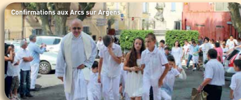
Confirmations aux Arcs sur Argens