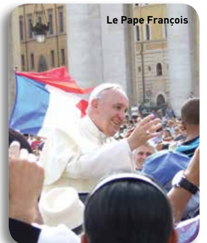
Le Pape François