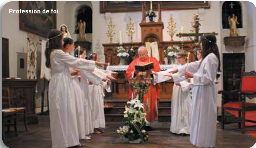
Profession de foi

James Foley journaliste américain décapité en Syrie le 19 août 2014