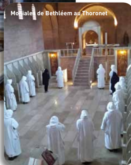
Moniales de Bethléem au Thoronet