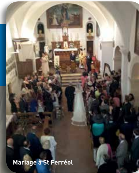
Mariage à St Ferréol