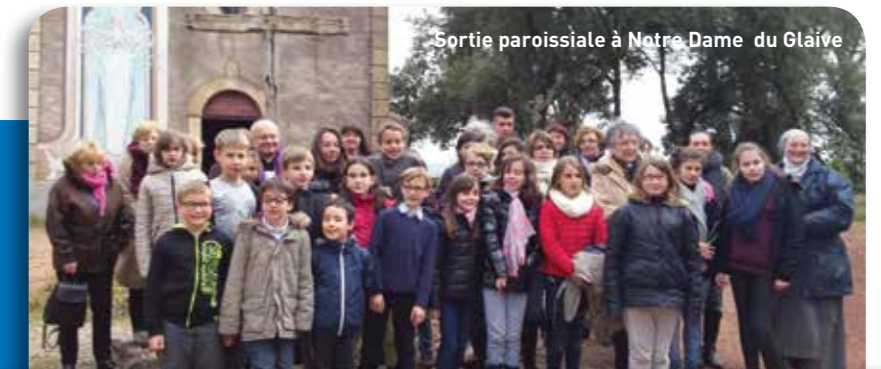
Sortie paroissiale à Notre Dame du Glaiève