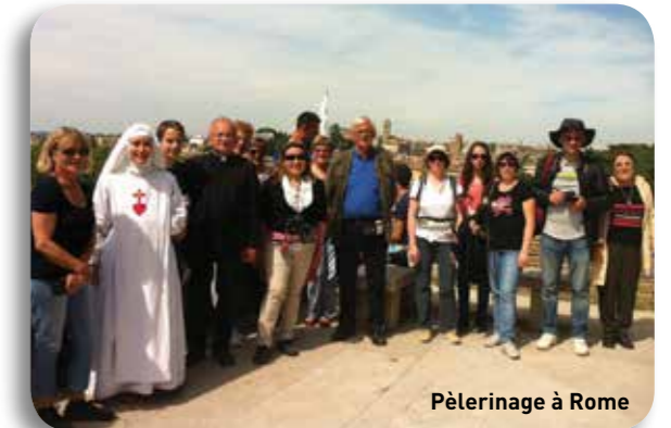
Pèlerinage à Rome

JEUDI 17h : Adoration Eucharistique pour les vocations. Confessions. 18h : Messe à St François d'Assise à Lorgues.