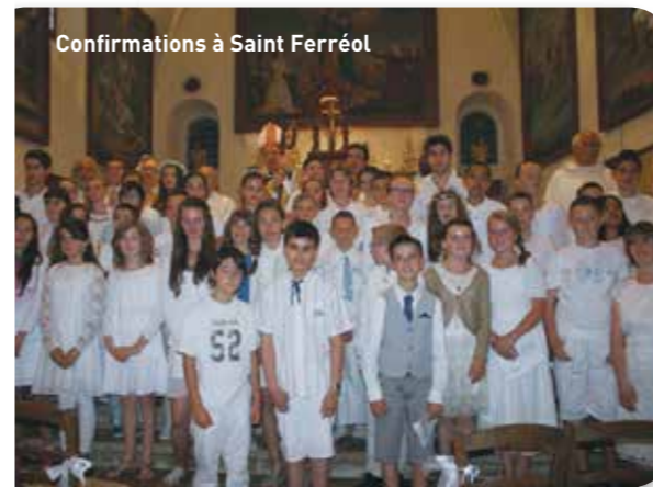
Confirmations à Saint Ferréol

Dimanche - 10h30 Messe à St François Lorgues