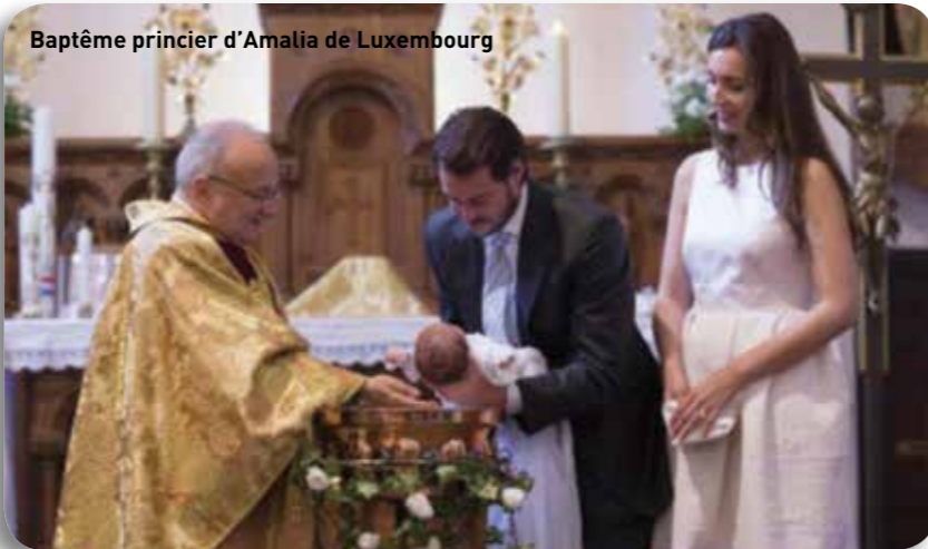
Baptême princier d'Amalia de Luxembourg