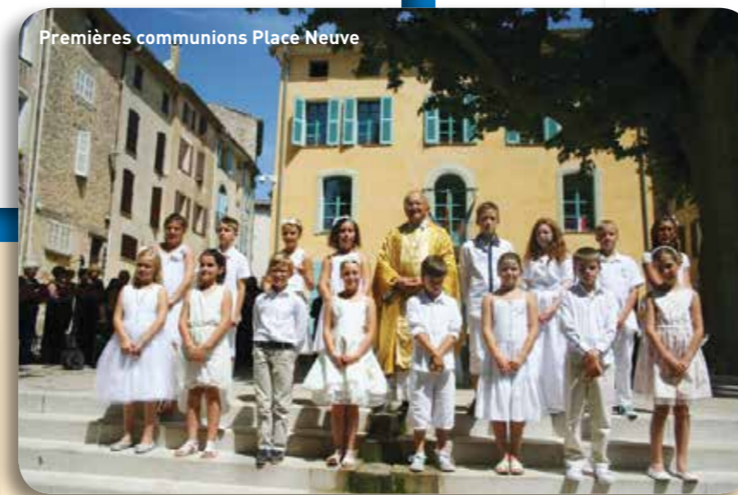
Premières communions Place Neuve

Ainsi pour les chrétiens, pour tous ceux qui ont été baptisés dans la mort et la résurrection de Jésus, leur vocation est claire : ceux qui meurent ont vocation à entrer dans l’éternelle gloire de Dieu : Jésus ressuscité. “Aujourd’hui, tu seras avec moi en paradis.” Que deviennent nos morts ? Ils sont avec Jésus dans sa gloire. Vous n’en saurez pas plus. Pour nous cette promesse, venant de Dieu, suffit. Vivons de tout notre cœur ces fêtes de Toussaint et du Jour des morts.