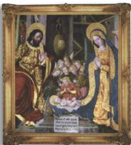
Chapelle Ste Roseline

Dimanche - 10h30 Messe à St François ou à St Ferréol Lorgues